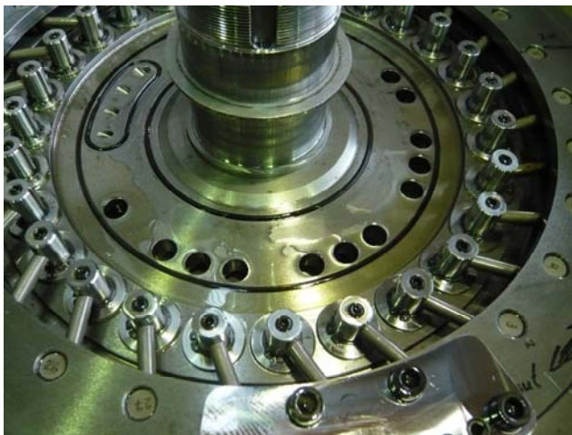
Stellingring (von oben)