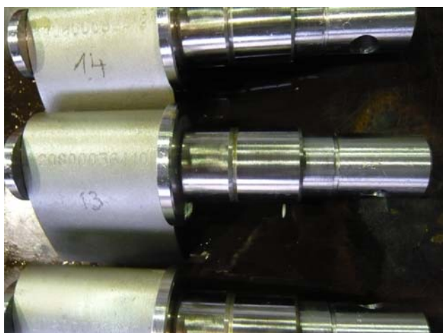
Leitschaufeln mit Lagerzapfen