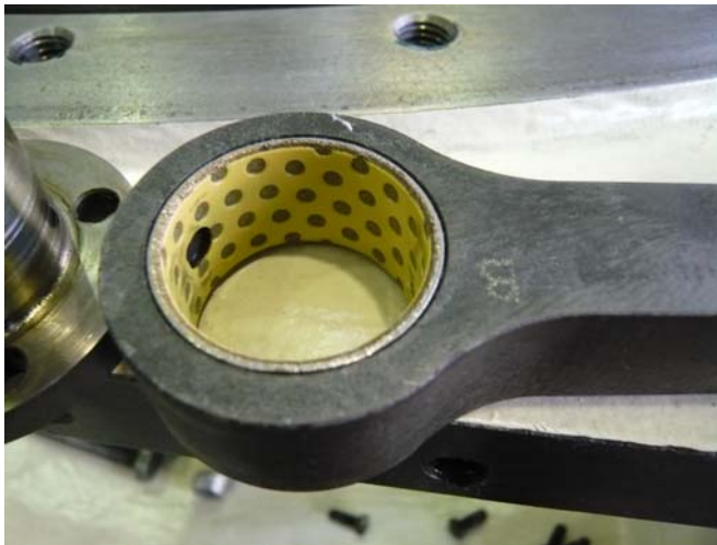
Koppelstange Betätigungszyylinder Stellingring mit Laufbuchse